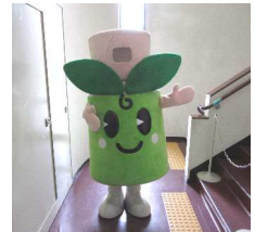
【たけまるくんが応援にきました】

平成29年5月27日（土） 生駒市たけまるホールにて公開医療講座を開催いたしました。100名の会場に107名と定員を超えるほどのご参加をいただきご聴講いただきました。誠にありがとうございました。大勢の皆さまにご参加をいただき大盛況の元無事終了いたしました。